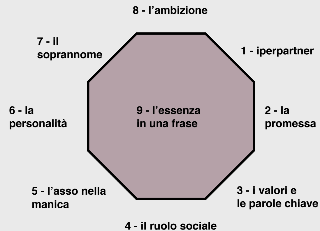
L'ottagono la carta d'identità della marca.